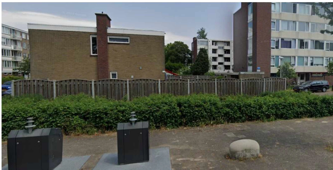
Schermafbeelding_2025-04-21_204627.png op 21-04-2025 20:50 door melder